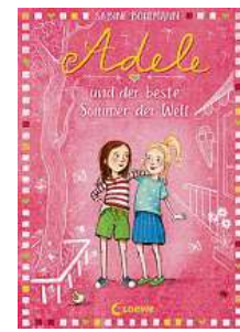
Sabine Bohlmann: „Adele und der beste Sommer der Welt“, Loewe Verlag, 12,95 Euro.

Die zehnjährige Adele erzählt alles in Ich-Form. Gut, dass auch Adeles Freundin Martha zu Hause geblieben ist! Die Illustrationen von Imke Sönnichsen lassen das Buch zusätzlich besonders schön wirken. Empfehlung: ab 8 Jahren.